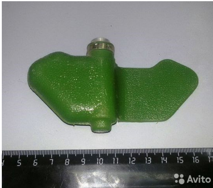
«Мина – ЛЕПЕСТОК» в боевом положении на земле (присыпана грунтом):